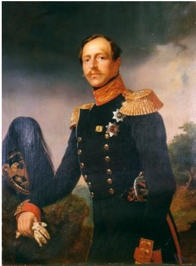
Ф. Крюгер. Портрет принца П.Г. Ольденбургского

Середина XIX века – время реформ в сфере женского образования в России. Одним из государственных деятелей, который всерьез занялся вопросом развития народного образования, стремясь сделать его доступным всем слоям русского общества, был принц Петр Георгиевич Ольденбургский, государственный деятель, благотворитель.