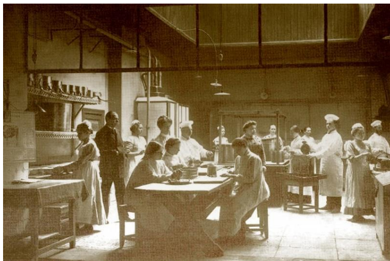
Воспитанницы Женского училища принцессы Терезии Ольденбургской на уроке домоводства.

переписывая какие-либо бумаги. В программе по арифметике было предусмотрено изучение простых чисел, простейшие арифметические действия с ними, простые и десятичные дроби. На уроках истории подробно изучалась история русского государства разных периодов. На географии давался обзор всех частей света, описание европейских государств и знакомство с их достопримечательностями. На уроках домоводства воспитанницы познавали азы ведения домашнего хозяйства, учились готовить, правильно сохранять продукты, сервировать стол.