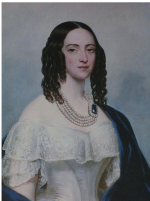
Жозеф-Дезире Кур. Портрет принцессы Терезии Ольденбургской

Первый набор составлял 35 учениц, но с каждым годом количество воспитанниц увеличивалось (в один момент их количество достигло 200), и поэтому уже в 1853 году был построен новый четырехэтажный корпус, соединявшийся с первым зданием училища переходом.