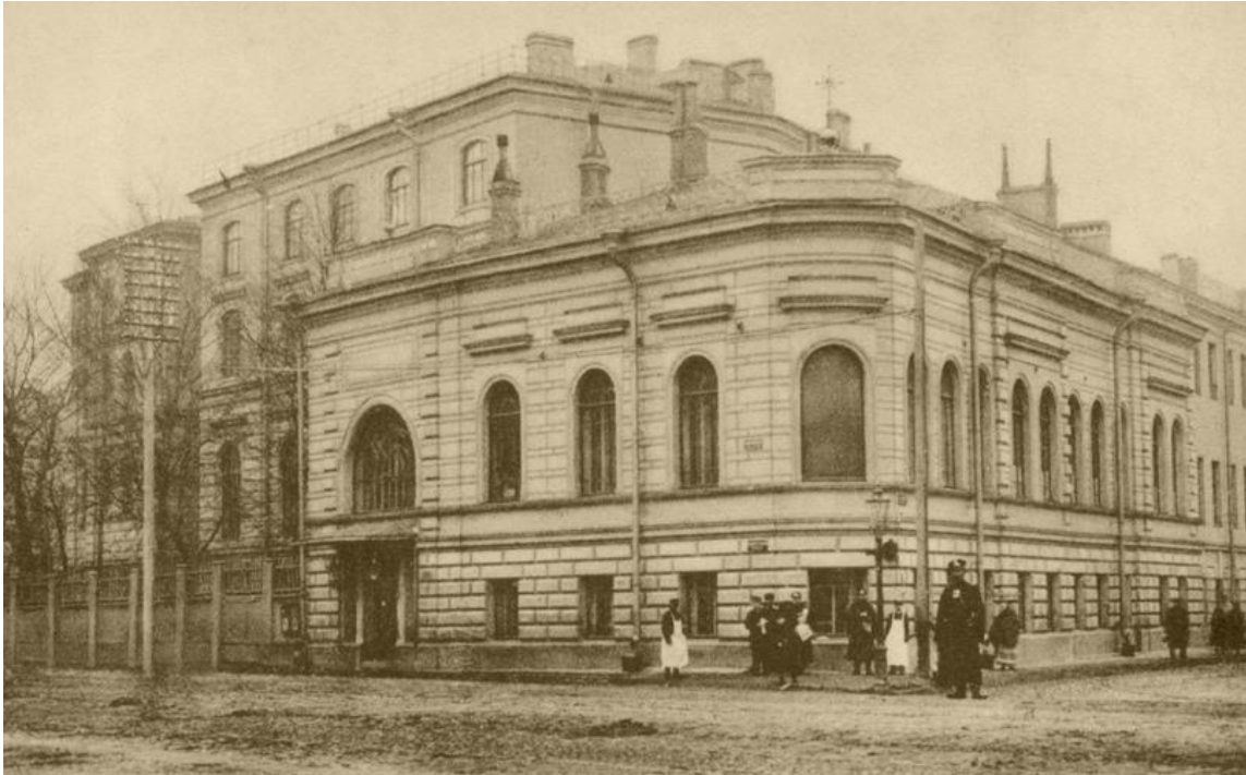
Здание Женского училища принцессы Терезии Ольденбургской (Каменноостровский пр. д. 36/73)

Для этого был куплен участок с двухэтажным зданием (1838 г. постройки) на углу Каменноостровского (дом 36) и Большого (дом 73) проспектов. Обустройством училища занялась супруга П.Г. Ольденбургского, принцесса Терезия, которая разделяла взгляды своего супруга и поддерживала все его инициативы. Она принимала участие в разработке всех нормативных документов училища: программы учебного курса, правил поведения для учениц, инструкции для управления училищем, где до мелочей было прописано его устройство, обязанности служащих и личная точка зрения принцессы Терезии на воспитание. Согласно Уставу в Училище принимали девочек из бедных семей всех свободных сословий от 6 до 13 лет и распределяли по классам в соответствии с их возрастом, знаниями и умениями. Первоначально обучение длилось 6 лет – всего было три класса с двухгодичным курсом в каждом. Училище было закрытым частным учебным заведением. Здесь воспитанницы не только учились, но и жили.