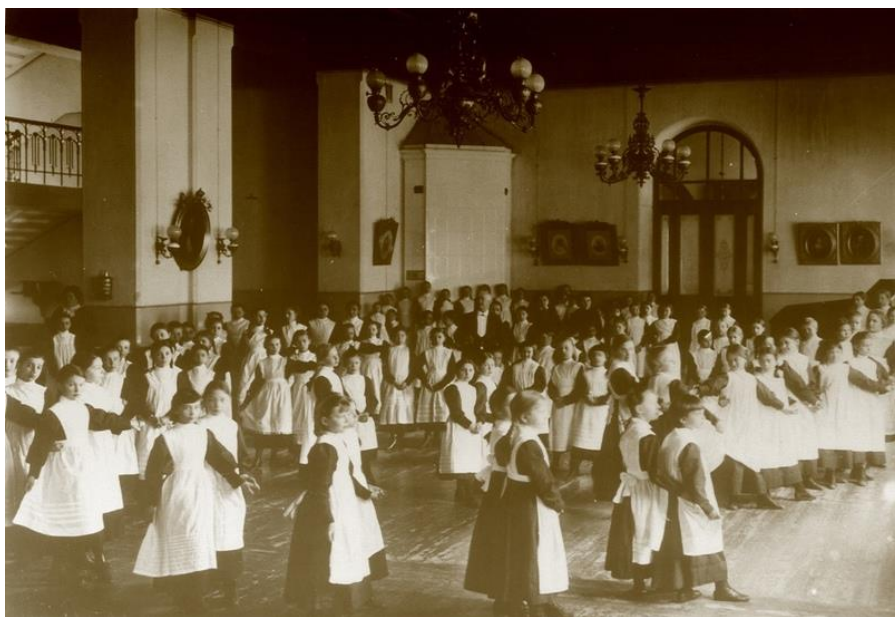
Воспитанницы Женского училища принцессы Терезии Ольденбургской на уроке танцев.

В 1855 г. министр просвещения Н. П. Норов по просьбе принцессы Терезии предоставил успешно закончившим училище выпускницам право получать свидетельство на звание домашней учительницы без нового экзамена в университете. В это же время воспитанницы училища были приравнены к воспитанницам казенных училищ второго разряда, хотя учебное заведение принцессы Терезии по-прежнему оставалось частным. Появились новшества: введены дополнительные классы, новые предметы: геометрия, естественная история, физика, алгебра, педагогика, гигиена, занятия по уходу за детьми, оказанию первой медицинской помощи, воспитанниц стали отпускать домой на рождество, пасху и летние каникулы.